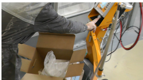
Krok 4: Rozpocznij proces automatycznego czyszczenia