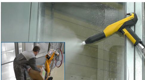
Krok 5: Zmień karton z proszkiem w czasie automatycznego czyszczenia