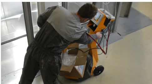
Krok 1: Włącz "air mover"