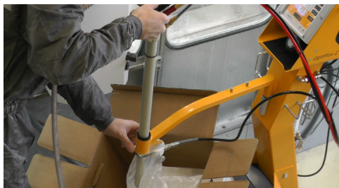
Krok 2: Podnieś rurę ssącą