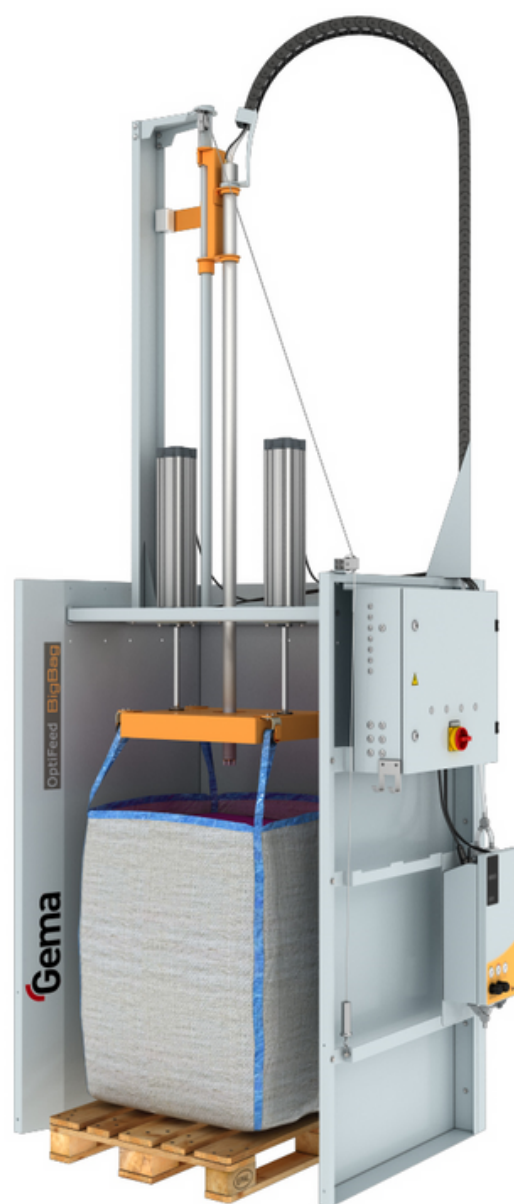
OptiFeed BigBag FPS16

Transport proszku jest monitorowany przez czujnik przepływu. Jeśli system wykryje, że spadła lub zatrzymała się wydajność przepływu farby, wtedy zostanie uruchomiony automatyczny podnośnik, który unosi i opuszcza worek BigBag-a w celu wyrównania poziomu farby.